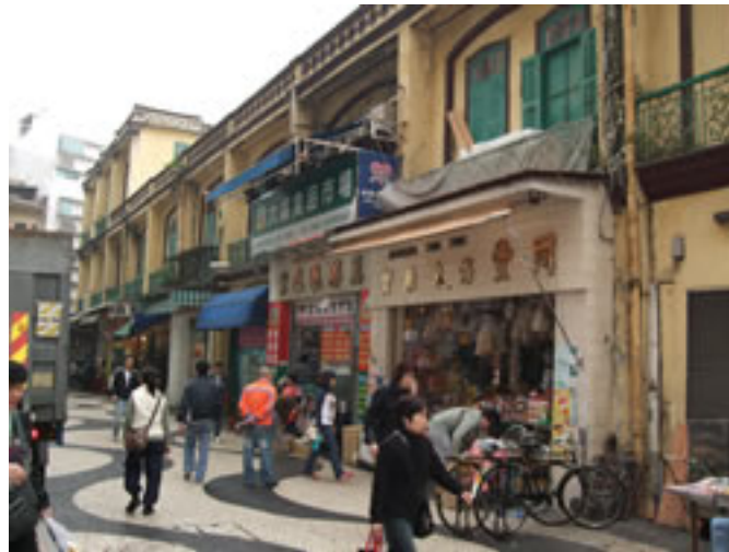
セナド広場からの裏路地

歩いている人に聞いてもそれぞれ言う事が違います。なんかおかしいなあ～と思っていたところ、自分達は大きな勘違いをしていたことに気がきます。そうなんです！マカオエッグタルトとは限定された店で売っているものではなく、マカオ中どこにでも売っている名物だったのです。