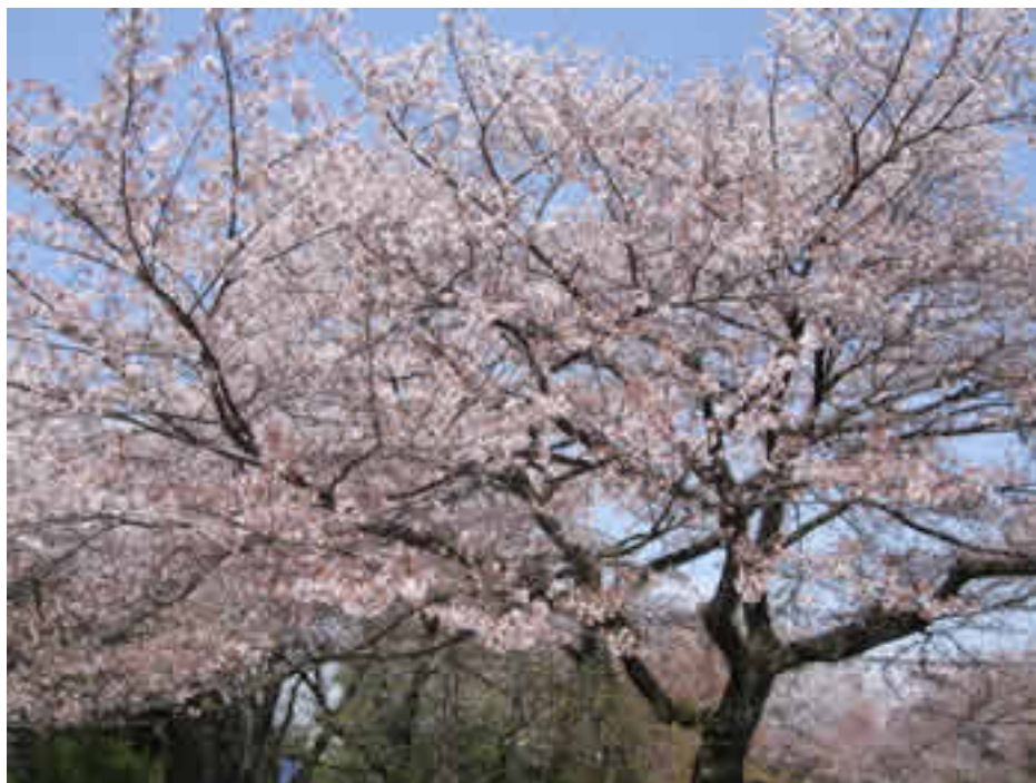
小田原市南町・西海子(さいかち)通りの桜トンネル (今年も咲きました。)