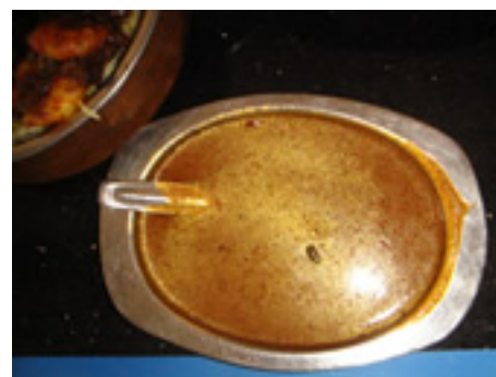
トッピング用カレーソース

上の写真は全て無料で付いてくるサイドディッシュです。中でも野菜のヨーグルト和えは絶品です。