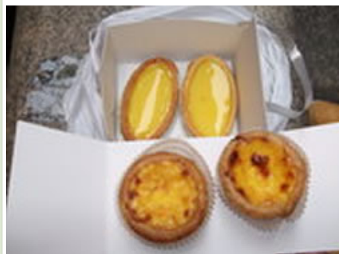
ケーキ屋さんのエッグタルト2種類

このエッグタルトは熱々で食べるのが美味しい食べ方のようで、どこのお店でも温めて出してくれます。