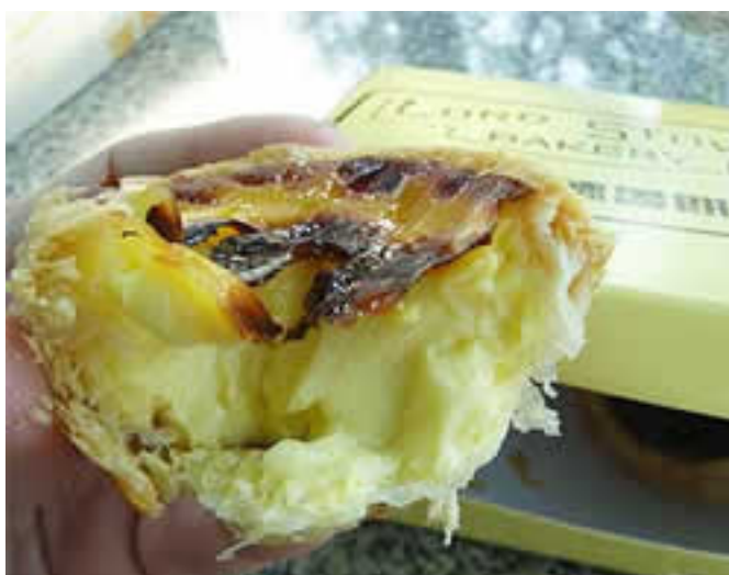
半分に割るとこんな感じです。