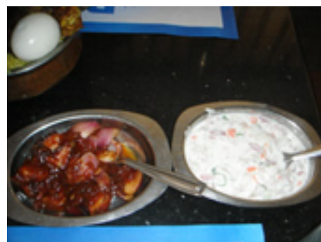
生たまねぎのサラダ (カレー風味) 野菜のヨーグルト和え