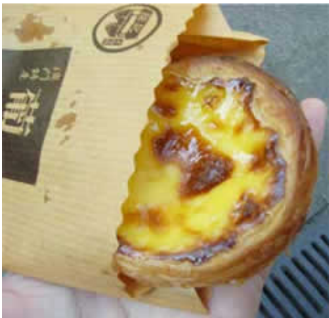
ガイドブックのお店のエッグタルト 一番最後に食べた物です。