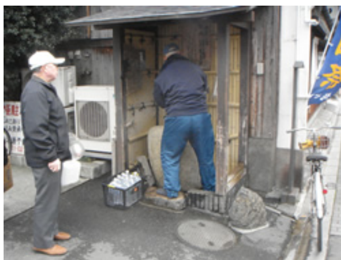
白菊水・水汲み場