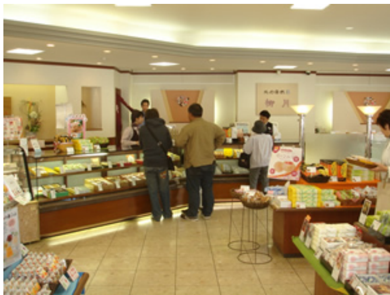
試食を頼んでいます。