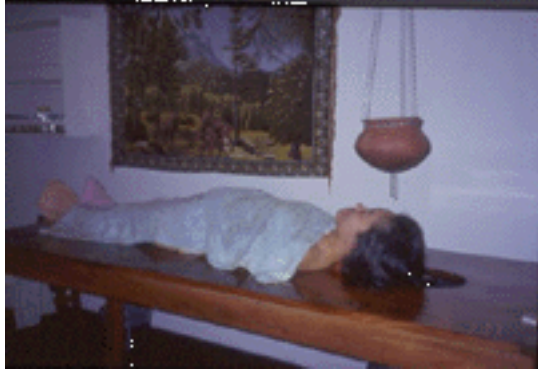
癒しの国・アーユルベーダ