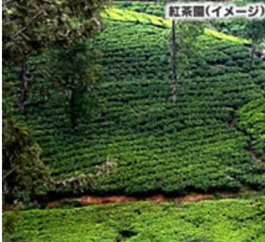
紅茶の国・スリランカ