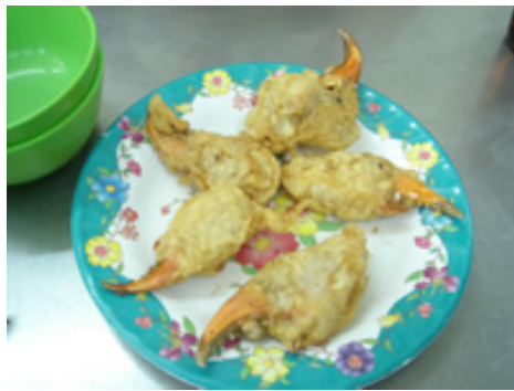
蟹爪のから揚げ 約350円