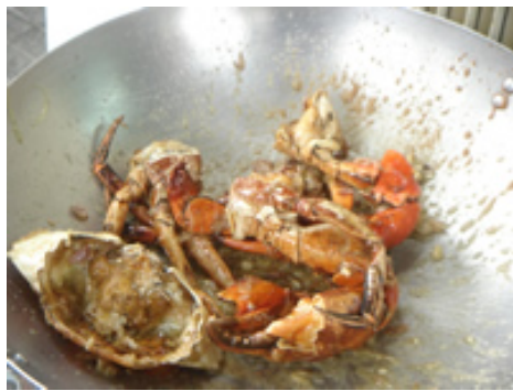
こんな感じで炒めてます。