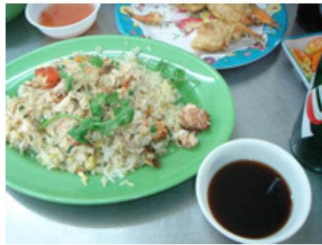
蟹チャーハン 約350円 ごはん和蟹の量が同じぐらい。