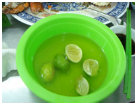
これで手を洗いながら食べます。

これは絶品です。ベトナムは世界最大の胡椒輸出国です。ベトナムに行ったら胡椒を使った料理を食べてみましょう。