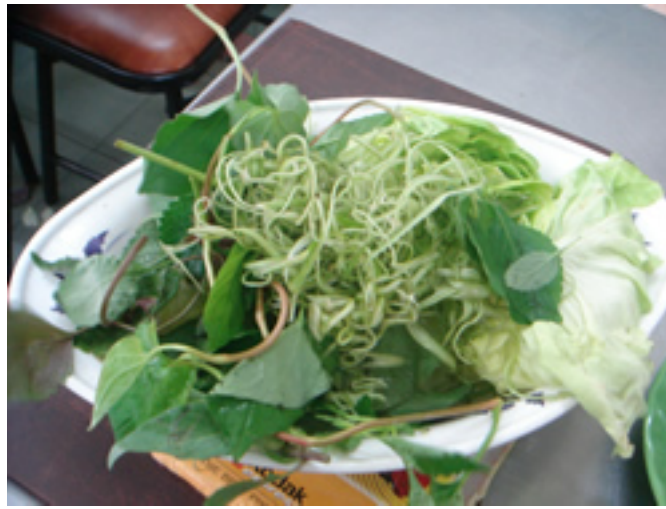
無料で付いてくる生野菜。

店頭でこんな感じで揚げます。 カメラを向けるとにっこりポーズ。 ベトナム人は愛想がいいです。