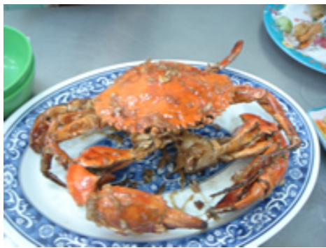
蟹の塩コショウ炒め 約1750円