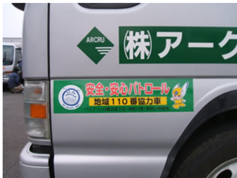
安心・安全パトロールステッカー

所在住所は2年前から各飲料自動販売機で貼付が始まり、弊社ではほぼ貼付は終了しています。 (知ってました？自分のいる位置を確認したい時は飲料自販機を確認してください。)