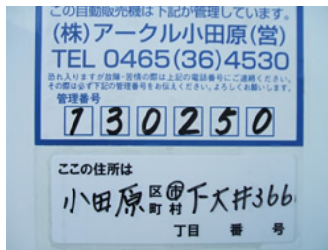
自動販売機現住所確認ステッカー

いや～、自動販売機の価値観が変わってきましたね。だだお金を入れてジュースを買うだけではなくなってきました。これからは携帯やスイカ・エディ等の電子マネー化も進んで来そうですし、もっともっと時代にあった変化をしていくと思います。